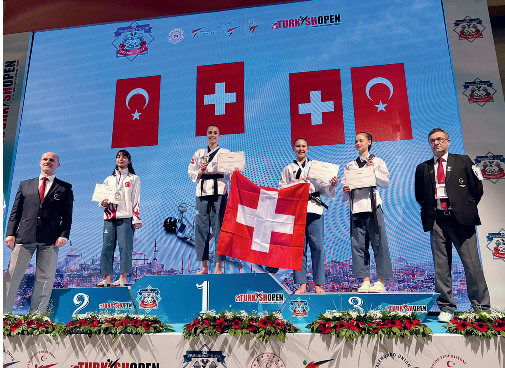
Zweimal die Schweizer Flagge bei der Siegerehrung der Turkish Open