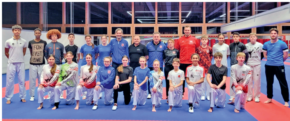
Teilnehmer am gemeinsamen Training

Für einen wertvollen Austausch hielt sich das Wettkampfkader vom 17. bis 19. Februar 2023 in Luxemburg auf. Während dreier Tage erlebten die zehn Athletinnen und Athleten mit der luxemburgischen Nationalmannschaft intensive Trainings unter Leitung von Nationaltrainer Waldemar Helm von Luxemburg und dem Schweizer National