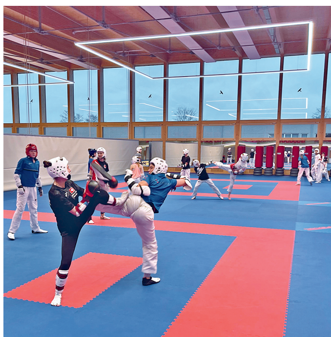
Training in Luxemburg

échange et souhaitent poursuivre leur collaboration. Pour les prochains entraînements communs, c'est probablement l'équipe de compétition de la Suisse qui jouera le rôle d'organisateur et d'hôte.