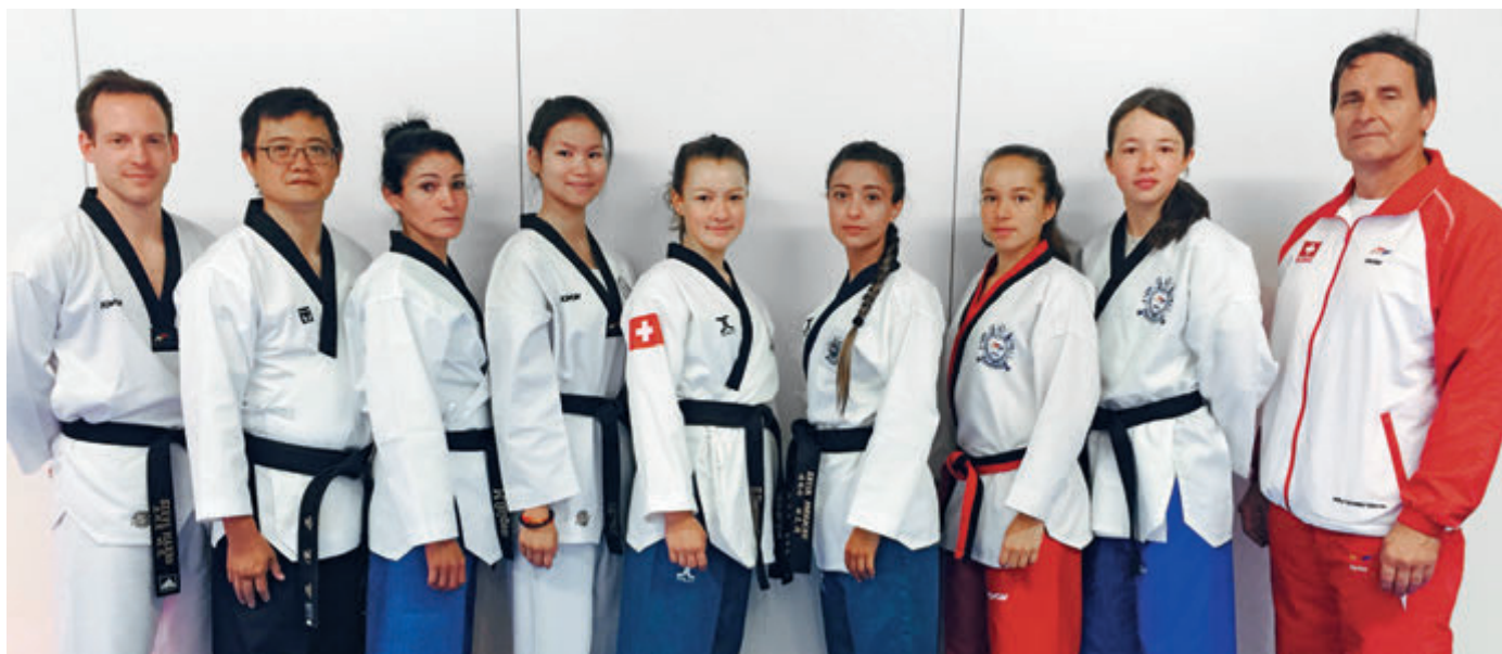
Der Poomsae-Nationalkader von Swiss Taekwondo